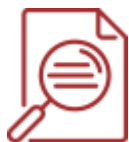
График контрольных мероприятий.

Требования к выставлению отметок за промежуточную аттестацию.